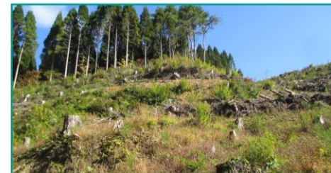
(一例) 3.56ha/8,900本の植林を実施した様子(4月~11月)